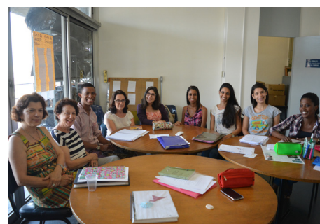
Os bolsistas do PROALFA são acompanhados semanalmente por supervisão pedagógica onde são elaborados os planejamentos de aula

Para adesão de novos interessados, não há distinção de idade, de sexo ou de nível de escolaridade. Mais informações podem ser obtidas pelo telefone (21) 2334-0723, sempre de segunda à sexta-feira, das 14h às 17h.