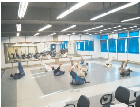
As aulas são voltadas para crianças e adolescentes de 8 a 17 anos